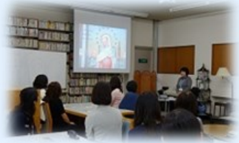
聖心会 みこころセンター