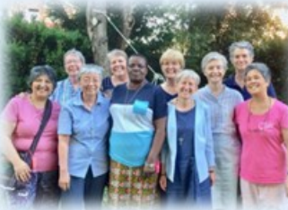
International Education Commission