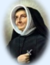
創立者 聖マグダレナ・ソフィア・バラ (1779-1865 フランス)

聖心会は聖マグダレナ・ソフィア・バラが1800年にフランスで創立した、教育を使命とするカトリック女子修道会です。イエスの聖心（みこころ）の愛に根ざして一人ひとりが「かけがえのない存在」として成長すること、また、この世界が「命へのあたたかいまなざし」に満ちた場となることを願って、世界41ヶ国に広がる約1,500人の会員が、様々な教育的分野で活動しています。