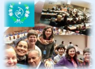
Sacred Heart at the UN

聖心会のシスター達は現代社会のニードに応えるために 様々な教育的なミッションに従事しています