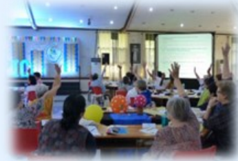
JPIC(正義と平和、創造界の保全) への取り組み