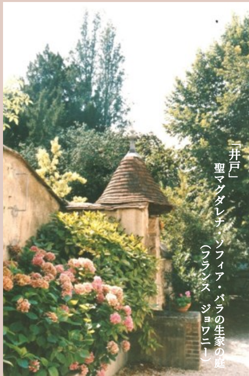
「井戸」 聖マгдаレナ・ソフィア・バラの生家の庭 (フランス ジョワニー)

(Bible Study, Prayer Meeting, Lecture in 2024)